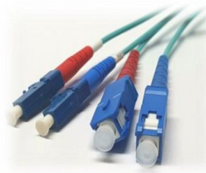
[ VJC2-12-OM3-LC/SC ]