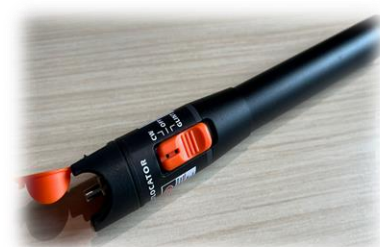
[ 광원(VLS) ]