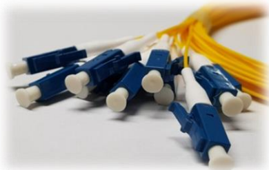
[ VJC6-12-SM-LC/LC ]