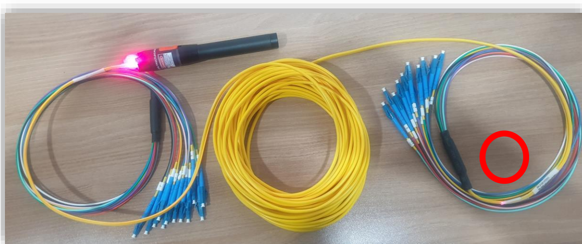
[ 다심케이블(VJC12-20-SM-LC/LC) 발광 모습 ]